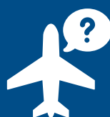
Název letecké společnosti