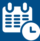
Datum a čas