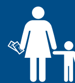
Podmínky pro cestování s dětmi

2 Provedu odbavení online nebo prostřednictvím samoobslužných kiosků na letišti, pokud to aerolinka umožňuje.